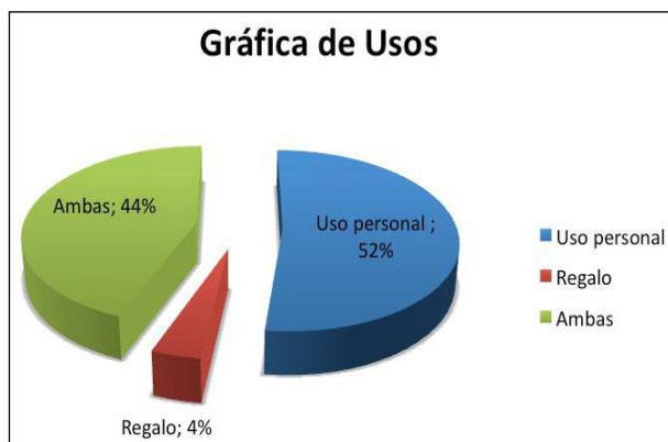
Ilustración 2. Ejemplo de ilustración.

Si resultan indispensables y sustanciales en relación con el contenido del artículo, podrán incluirse ilustraciones, fotografías o tablas de ancho mayor, las cuales deberán centrarse en la página.