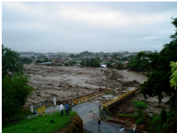
Fotografía 1. Ejemplo de fotografía.